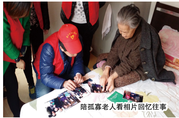
陪孤寡老人看相片回忆往事

本报讯（文法系）3月是全国学习雷锋月，为大力弘扬雷锋精神和“奉献、友爱、互助、进步”的志愿服务精神，提升同学们的人文修养，促进同学们政治思想觉悟的不断提高，传承雷锋艰苦朴素的优良作风。